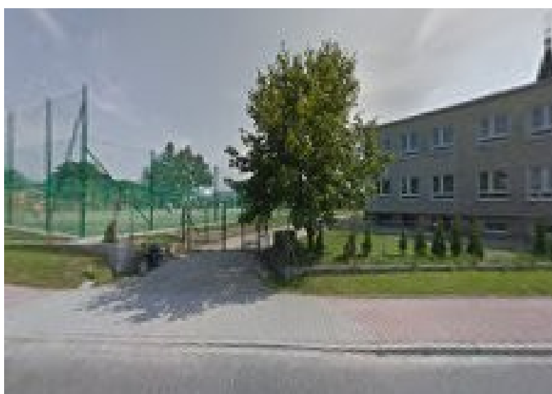
Boisko przy Szkole Podstawowej w Borzęcie

https://pl.wikipedia.org/wiki/Borz%C4%99ta