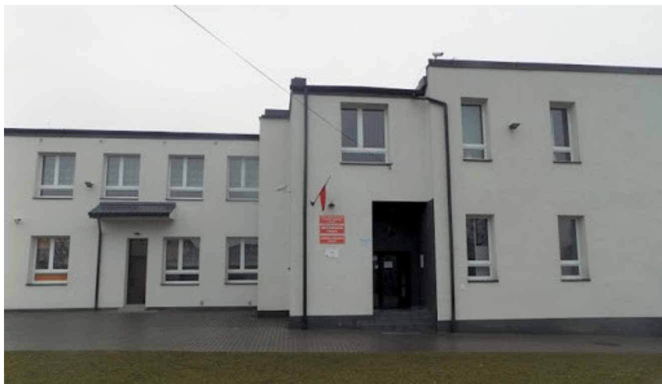
ZPO w Borzęcie ( budynek szkoły i przedszkola)