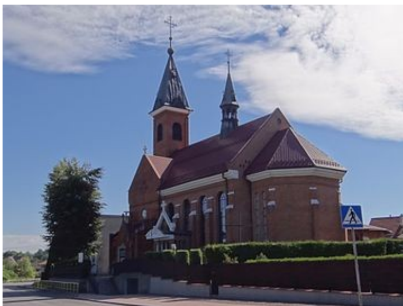
Kościół w Borzęcie

Rodzic prezentuje dziecku zdjęcia i zadaje mu pytania: Czy znasz te obiekty? Co to jest?