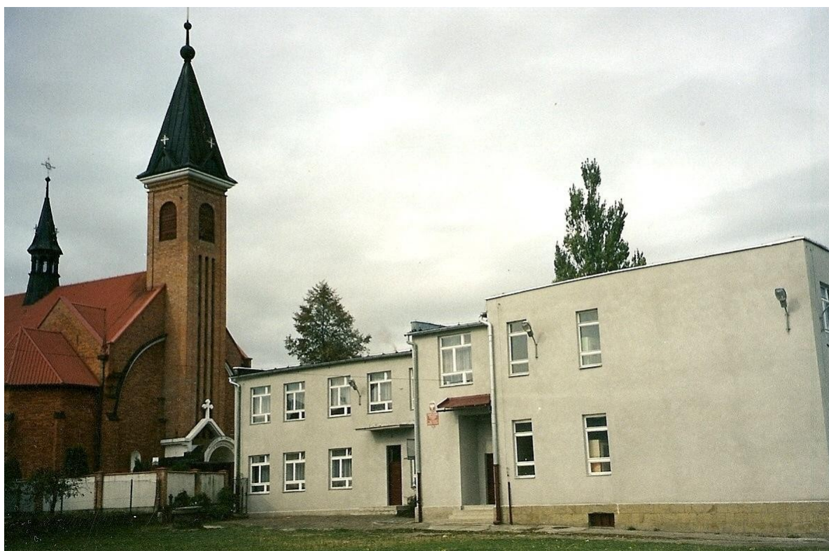
Kościół i ZPO w Borzęcie http://gazeta.myslenice.pl